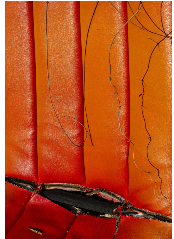
8am Walks: Mittelbuschweg, 2020 fotografia, 100x70 cm

Le immagini di Jeremy traggono schemi e umorismo dalla casualità e dai non-eventi ripetitivi che caratterizzano il banale delle nostre vite - gli aspetti trascurati e spesso inosservati della nostra esistenza che ci rendono umani. La sua esplorazione quotidiana della città diventa un giocoso rituale di documentazione delle tracce umane sulla superficie urbana.