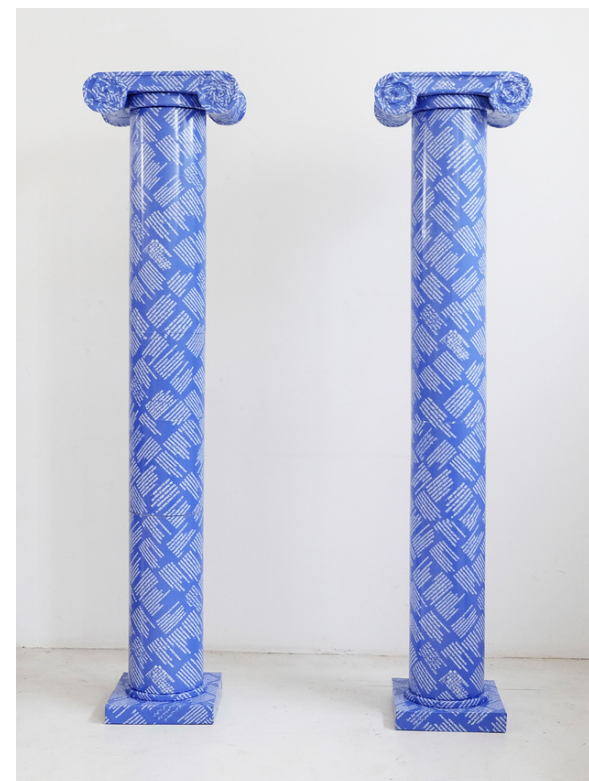
In Between, 2020 tecnica mista, installazione site specific

La sua ricerca nasce in seguito al trasferimento fra due paesi, Cina ed Italia, oriente ed occidente. Nel continuo spostamento tra culture diverse, che si tratti di movimenti fisici o turbolenze spirituali, l'identità creata è destinata ad essere multipla, complessa e mista. Nascono costantemente nuovi contenuti capaci di cambiare ed influenzare elementi della realtà sociale nella quale ci si trova. L'idea della cosiddetta globalizzazione od omogeneizzazione è messa in contrapposizione al fenomeno della diversificazione come premessa della "Mondializzazione".