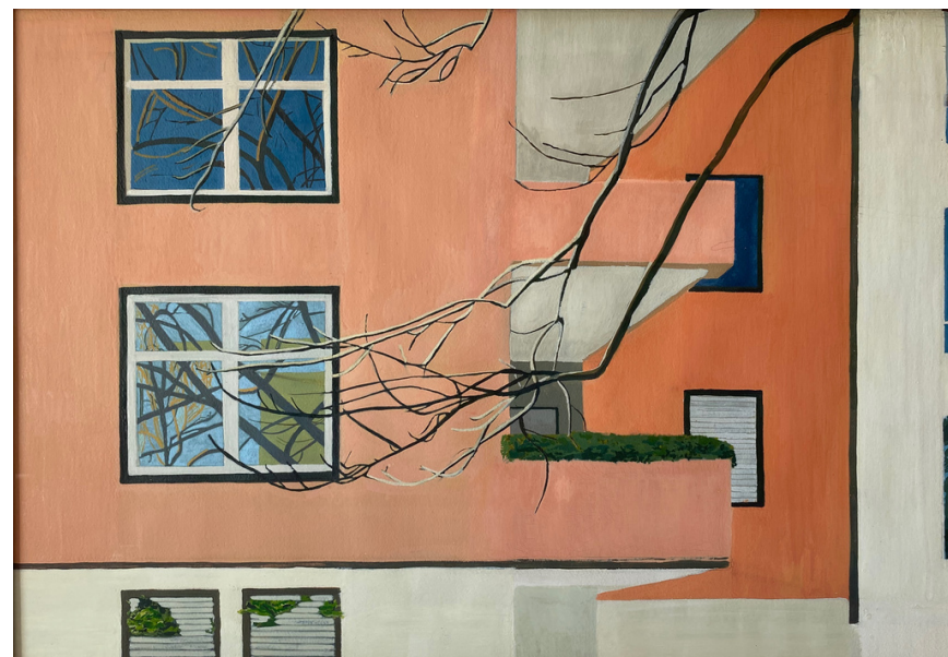
Milan Balconies, 2019 gouache su carta, 56x40 cm

Conosciuta per i suoi dipinti di nature morte di edifici e interni italiani, l'artista e illustratrice si ispira alla sua infanzia, esplorando scene che si percepiscono come familiari e confortanti. Creando una metamorfosi tra interno ed esterno, fonde i due insieme, innescando un dialogo visivo tra il nostro "dentro" e "fuori", attirando la nostra attenzione sulle trasformazioni che avvengono.