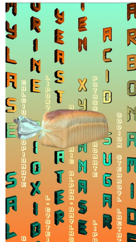
The Picture of Health, 2020 video

Con un focus sul Antropogene e la digitalizzazione - due movimenti che hanno cambiato permanentemente il corso della vita umana sulla terra - queste opere d'arte speculative immaginano infiniti scenari possibili, cambiamenti nelle nostre abitudini e trasformazioni che avvengono come risultato di questi - dove i nostri schermi sono frequentati da pubblicità per antidepressivi AI e servizi di clonazione di animali estinti.