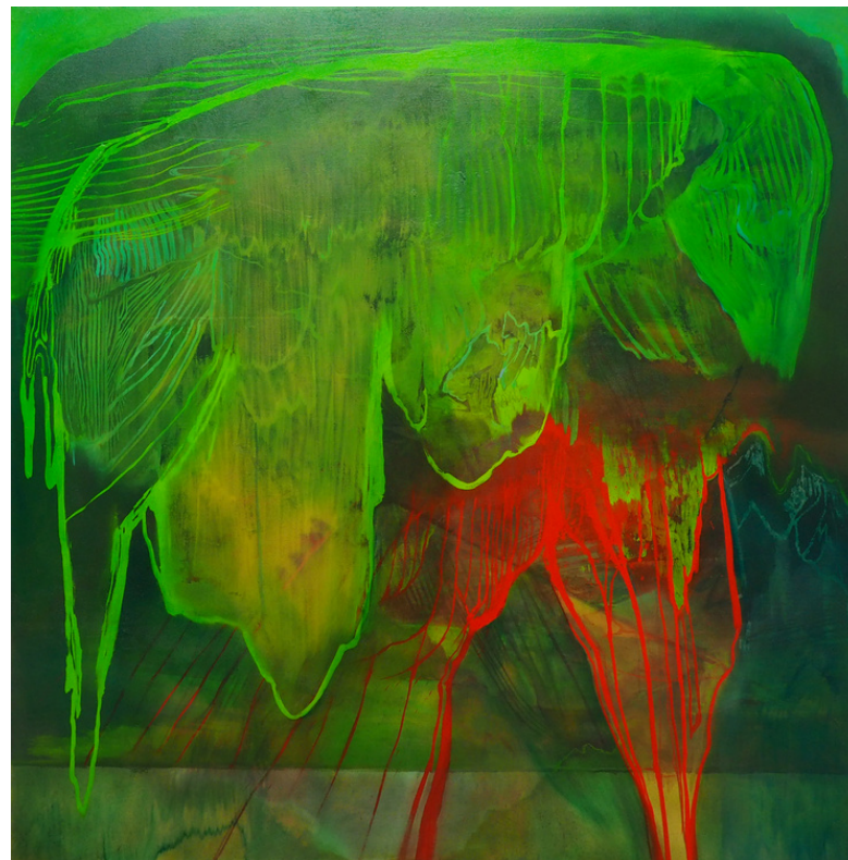
Il mio pastore, 2020 olio su tela, 100x100 cm

La sua ricerca si concentra sulla consapevolezza critica dell'antropocentrismo e di come il posizionamento dell'uomo non sia mai neutrale nell'ecosistema. Attraverso la sua arte commenta la conversione della natura e come questa trasformazione influenzi le nostre vite e le nostre menti. Le sue opere dipingono una visione aerea, macro di dettagli che vengono ridefiniti, scomposti e moltiplicati con un paesaggio anatomico sottostante.