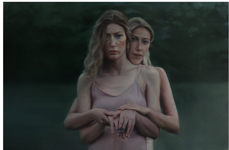
Chi siamo, 2020 olio su tela, 100x150 cm

La condizione umana è la protagonista del suo lavoro e la figura femminile il suo punto fermo più riconoscibile, tanto da esserne il fulcro del proprio spazio interiore. L'ambiente circostante e quando presenti anche gli oggetti di scena, sono usati come strumenti per abbracciare ulteriormente l'emozione tangibile che il quadro trasmette, elemento cruciale della visione dell'artista.