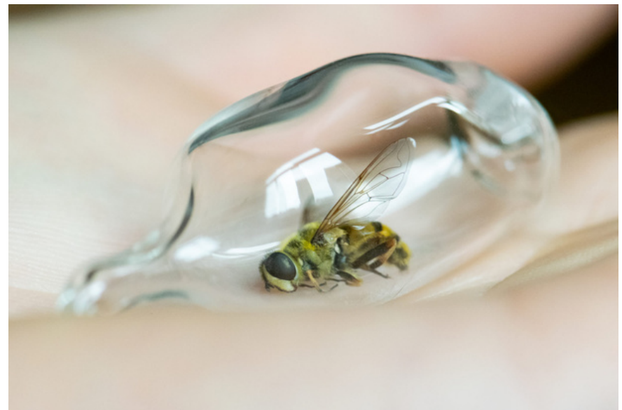
Cocoon, 2020 tecnica mista

L'attenzione di Gromoll è rivolta a organismi naturali, spesso da noi trascurati, che possono essere trovati anche nei luoghi più comuni. Sono esseri viventi identificati come vulnerabili, fragili e delicati, ma portatori di un'immensa bellezza e che allo stesso tempo mostrano vitalità e forza naturali. La sua pratica artistica consiste in interventi minimi al fine di mettere in luce un determinato aspetto, mostrandolo nel modo più autentico possibile.