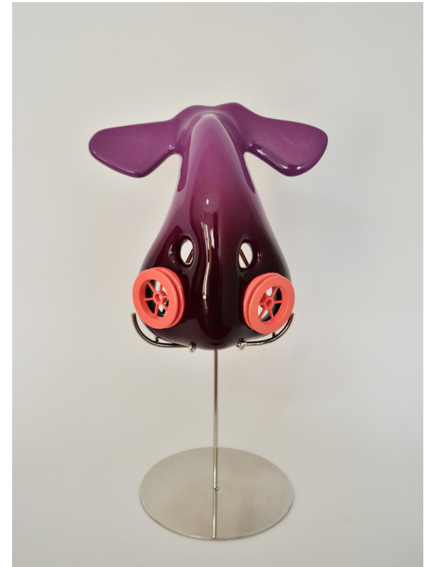
Brand new breath, 2019 scultura, 15x15,5x7,5 cm

La sua ricerca artistica ruota attorno all'analisi delle attitudini della società contemporanea e del funzionamento del corpo umano. Nello specifico rivolge la propria attenzione ai trattamenti e alle procedure mediche a cui ci sottoponiamo, evidenziando i tentativi ossessivi di perfezionare il naturale e mettendo in discussione il futuro benessere degli esseri umani.